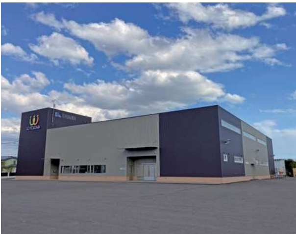
苫小牧介護用品管理センター(レンタコムウェル苫小牧)

2023年6月苫小牧市に新しく消毒・管理センターがオープンしました。最新鋭の設備できれいに消毒された安心・安全な商品をご提供いたします。