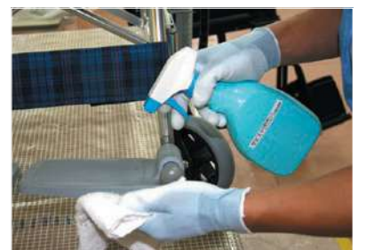
アルコールによる清拭消毒 (アルコール消毒)