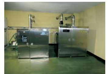
車いす全自動洗浄消毒機 (煮沸消毒)