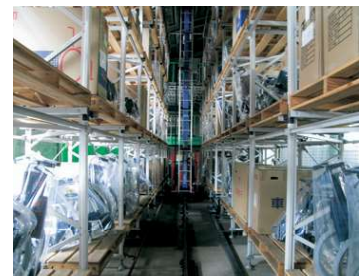
レンタコムウェル札幌 白石営業所