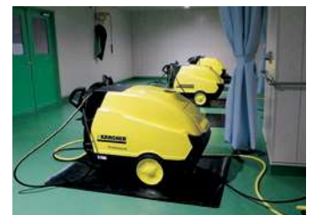
高温スチーム洗浄機 (煮沸消毒)