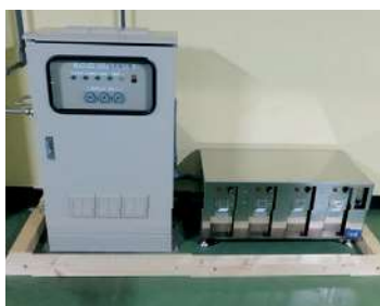
オゾン制御装置 (オゾンガス消毒)