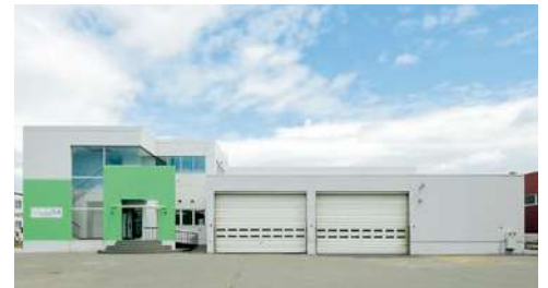
札幌介護用品管理センター(石狩市)

シルバーマークの主な認定基準に適合しているかどうかは、厳正に調査されます。書類による調査だけでなく、シルバーサービス振興会の調査員による実地調査を実施、それらの結果に基づき、消費者団体の代表、福祉・医療の専門家、学識経験者などから成る「シルバーマーク基準認定委員会」が最終的に審査の上、シルバーマークが交付されます。