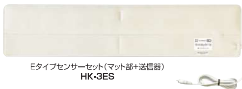
Eタイプセンサーセット(マット部+送信器) HK-3ES