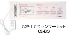
起き上がりセンサーセット CI-BS