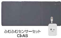
ふむふむセンサーセット CI-AS