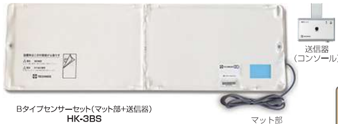
Bタイプセンサーセット(マット部+送信器) HK-3BS