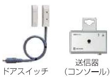
Dタイプセンサーセット(ドアスイッチ+送信器) HK-3DS